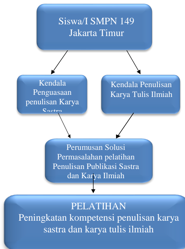
Gambar 1. Kerangka Solusi Penyelesaian Permasalahan

Metode pelaksanaan dalam penyelesaian masalah pada pelatihan peningkatan keterampilan penulisan karya tulis ilmiah dan karya sastra yaitu melalui penyuluhan dan praktek serta pendampingan langsung. Pelaksanaan pelatihan dilakukan dengan secara tatap muka di ruang aula dengan materi penulisan karya sastra dan karya tulis ilmiah. Untuk menyelesaikan permasalahan yang dihadapi mitra, solusi yang ditawarkan oleh tim abdimas adalah sebagai berikut :