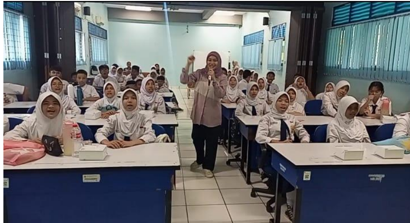
Gambar 5. Foto Bersama setelah kegiatan berlangsung