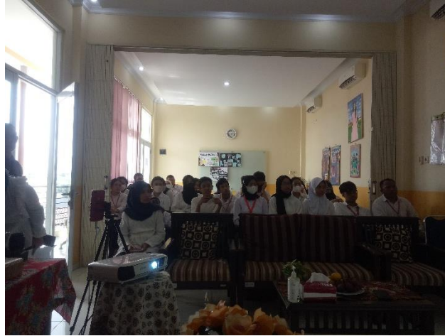
Gambar 2. Peserta Pengabdian kepada Masyarakat