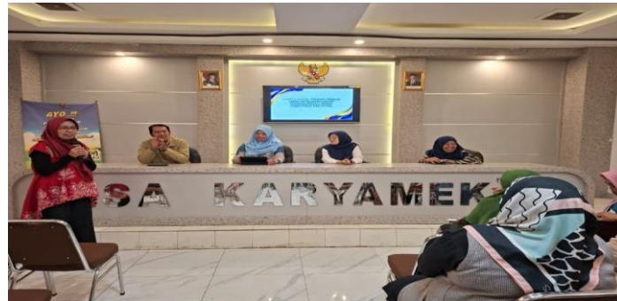
Gambar 3. Penyampaian Materi oleh Dosen