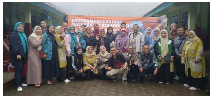
Gambar 4. Photo bersama peserta setelah pelaksanaan