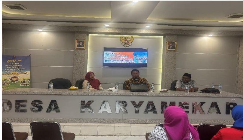
Gambar 1. Lokasi Pelaksanaan Abdimas, Aula Kantor Desa Karyamekar, Pasirwangi, Kabupaten Garut, Jawa Barat

Pelatihan manajemen keuangan rumah tangga bagi ibu-ibu PKK di Desa Karyamekar diikuti oleh 30 peserta yang berasal dari berbagai RT di desa tersebut. Data awal yang diperoleh melalui kuesioner pra-pelatihan menunjukkan bahwa 70% peserta belum memiliki pencatatan pengeluaran rutin , sedangkan 60% tidak memiliki rencana anggaran bulanan . Selain itu, hanya 40% peserta yang memiliki tabungan rutin , dan sebagian besar mengaku kesulitan mengatur pengeluaran untuk kebutuhan mendesak dan pendidikan anak.