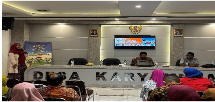
Gambar 2. Lokasi Pelaksanaan Abdimas, Aula Kantor Desa Karyamekar, Pasirwangi, Kabupaten Garut, Jawa Barat