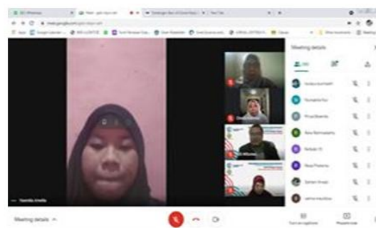
Gambar 4 Diskusi / Tanya Jawab Pemateri dan Peserta

webinar adalah memberikan pengetahuan dan skill sebanyak mungkin yang berhubungan dengan persiapan kerja, mulai dari bagaimana mencari informasi-informasi lowongan kerja, membuat lamaran, CV, sikap dalam wawancara, menanamkan rasa kejujuran dan tanggung jawab.