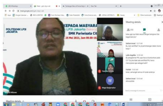
Gambar 2 Perkenalan dengan peserta webinar

https://docs.google.com/forms/d/e/1FAIpQLSfleHIT4fQ29t0bEQGy1krfmUIM-ZG1ufIVp4DeJIOaIZdswg/viewform?usp=sf_link