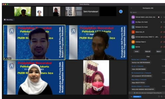
Gambar 1 Pembukaan Kegiatan Abdimas

Menurut Gibson et al., 2012 dalam Wijiyono, W. 2019 menyatakan pengambilan keputusan juga berkaitan dengan memilih suatu tindakan saat menghadapi situasi yang melibatkan beberapa alternatif, membandingkan diantara alternatif, menggunakan alternatif terpilih untuk memecahkan masalah dan mengevaluasi hasilnya dalam organisasi.