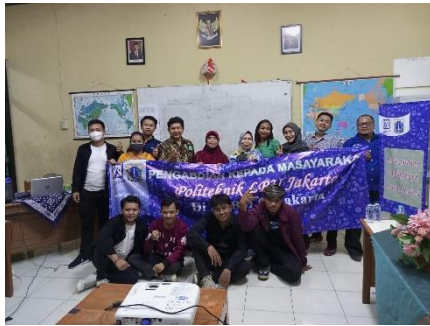
Gambar 5. Penutup Kegiatan Pengabdian kepada Masyarakat

Kegiatan pengabdian kepada masyarakat ini memperoleh respon yang baik dari peserta didik dan tutor di PKBM 02 Karet Jakarta Pusat. Hal ini terlihat dari hasil evaluasi yang diperoleh setelah kegiatan berlangsung.