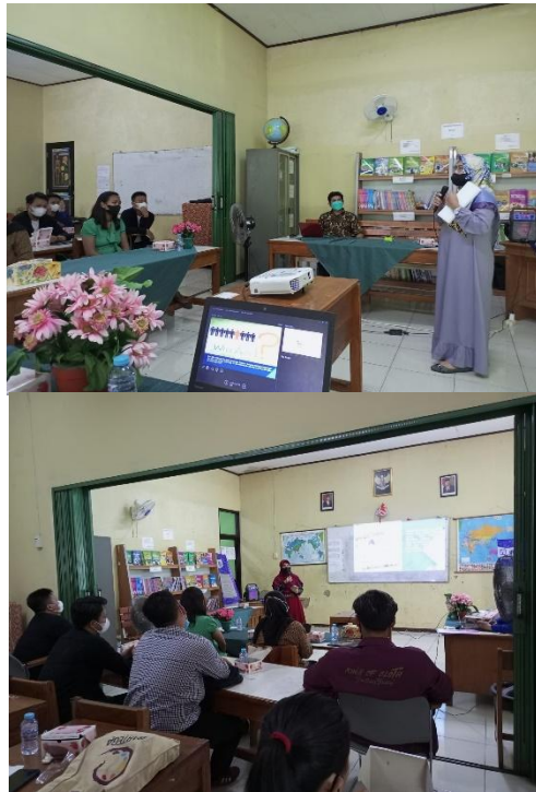
Gambar 3. Pemaparan Materi