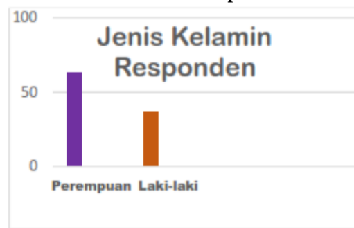
Tabel 1 Jenis Kelamin Responden

Dari hasil sebaran sampel penelitan didapati bahwa sebagian besar responden adalah berjenis kelamin wanita yaitu sebanyak 63%, sisanya sebanyak 37% adalah laki-laki.