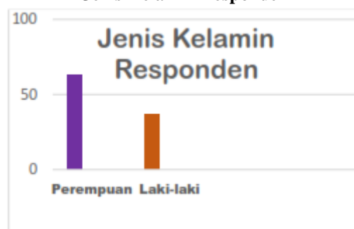
Tabel 1 Jenis Kelamin Responden

Dari hasil sebaran sampel penelitan didapati bahwa sebagian besar responden adalah berjenis kelamin wanita yaitu sebanyak 63%, sisanya sebanyak 37% adalah laki-laki.